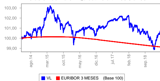
Evolución del valor liquidativo últimos 5 años